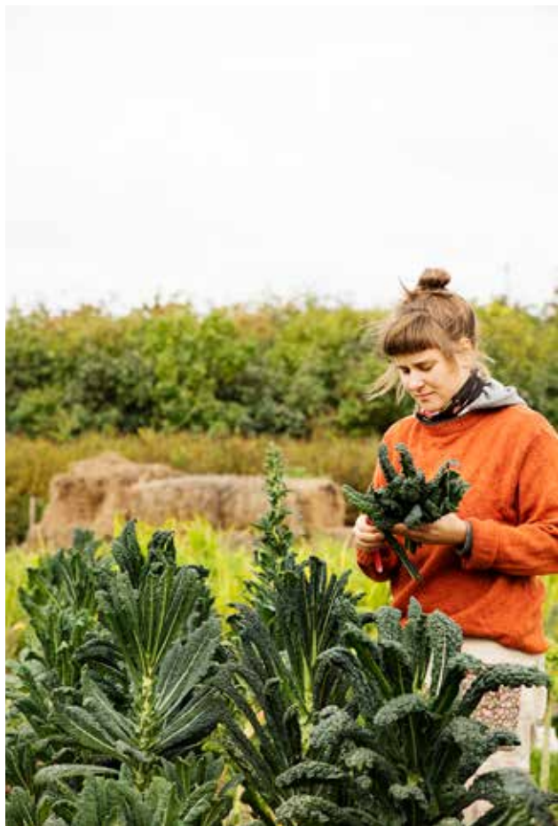
Skörd av Palmkål vid Västra Skrävlinge i Malmö.