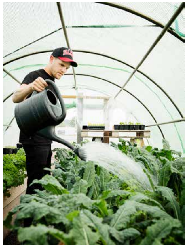
Ovan: Stadsbruk Countryside, Earthculture Farm i Göteborgs stadsrand. Nedan: Stadsbruk Urban, odling i pallkragar av Kajodlarna vid Frihamnen i Göteborg.