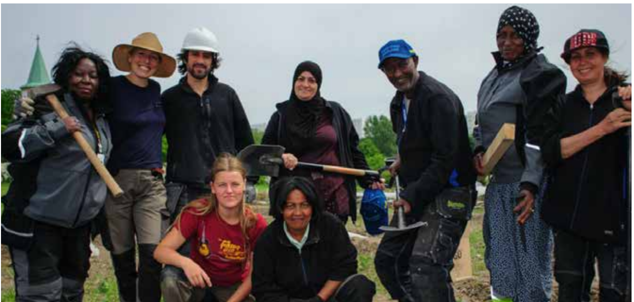
Botildenborg. Växtplats Rosengård syftar till att få nyanlända och utrikesfödda i arbete. Deltagare kommer till Botildenborg för arbetsplatsförberedelse och därefter till praktik på företaget. Samtidigt arbetar projektet med att utbilda företag i social hållbarhet och mångfald.