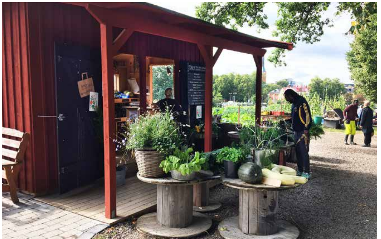
Ekobacken i Växjö med grönsaksförsäljning.