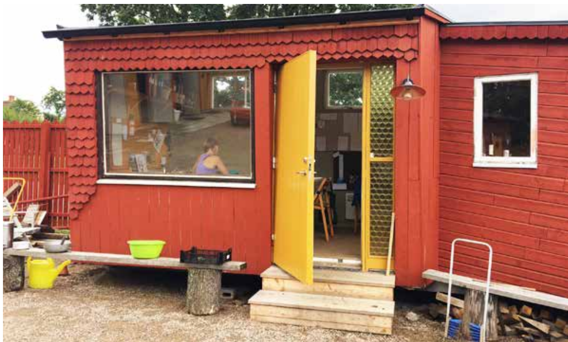
Växjö - Ekbacken, arbetsbod.

av staden. Sabotage och stöld kan förekomma liksom att grödor kan förorenas eller smittas. En viktig lärdom att ta med sig från tidigare genomförda stadsbruk är att ny användning av ett område bör planeras med odlare, boende och närliggande verksamheter för att försäkra sig om goda relationer mellan kommun eller annan facilitator, närboende och odlare. Om området har inofficiella användningsområden som hundrastning, sportutövande, rekreation eller annat, är det viktigt att tidigt föra dialog med närboende för att skapa förståelse för deras intresse och bjuda in till samexistens på platsen. Vid anläggning och när odlingen väl är igång är det att rekommendera skyltning och tydlig information om vad som sker på platsen, vem som odlar och vilka delar som eventuellt är tillgängliga för allmänheten.