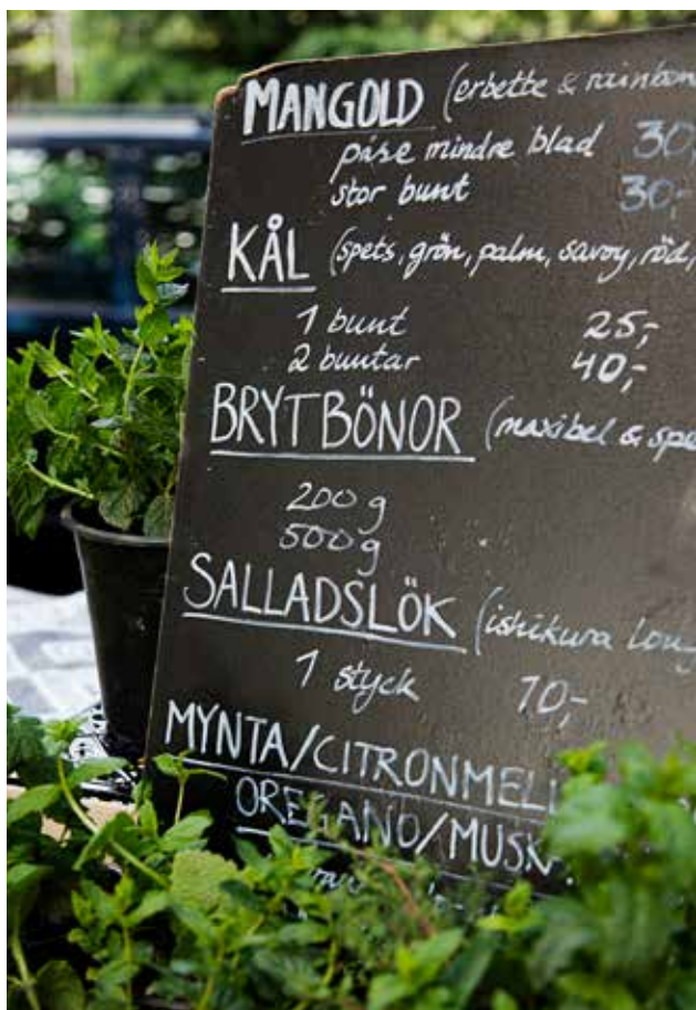
Försäljning av Stadsbruks grönsaker på marknaden Stadens Skaffereri i Folkets Park i Malmö.

Du har nu introducerats till Stadsbruk som koncept och projekt, fått en inblick i genomförda stadsbruk i olika kommuner och tagit del av reflektioner och erfarenheter från dem. Det kommande kapitlet är utformat som en handbok. Den är tänkt att fungera som en vägledning till kommuner som vill öka sin förståelse för hur de kan stärka förutsättningarna för att etablera stadsbruksodlingar inom kommunens gränser – både långsiktigt på strategisk nivå och mer kortsiktigt eller i närtid på mer operativ nivå.