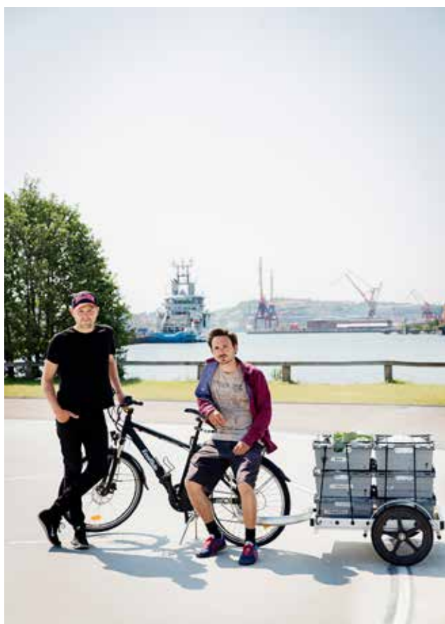
Kajodlarna i Göteborg. Går att nå med både kollektivtrafik och cykel. Odlarna kör själva ut sina grödor med cykel.

En annan reflektion är att staden och odlingen påverkar varandra. Odling kan öka tryggheten i ett område genom att skapa närvaro och förutsättningar för möten, föra odlare och konsumenter närmre varandra, vara estetiskt tilltalande och inspirera fler till att odla. Det finns dock potentiella störningsmoment med odling i staden då det vid tillfällen kan lukta gödsel, vara maskinljud som stör och på vinterhalvåret se mindre tilltalande ut med bar jord. Det finns även en risk att odlingen störs