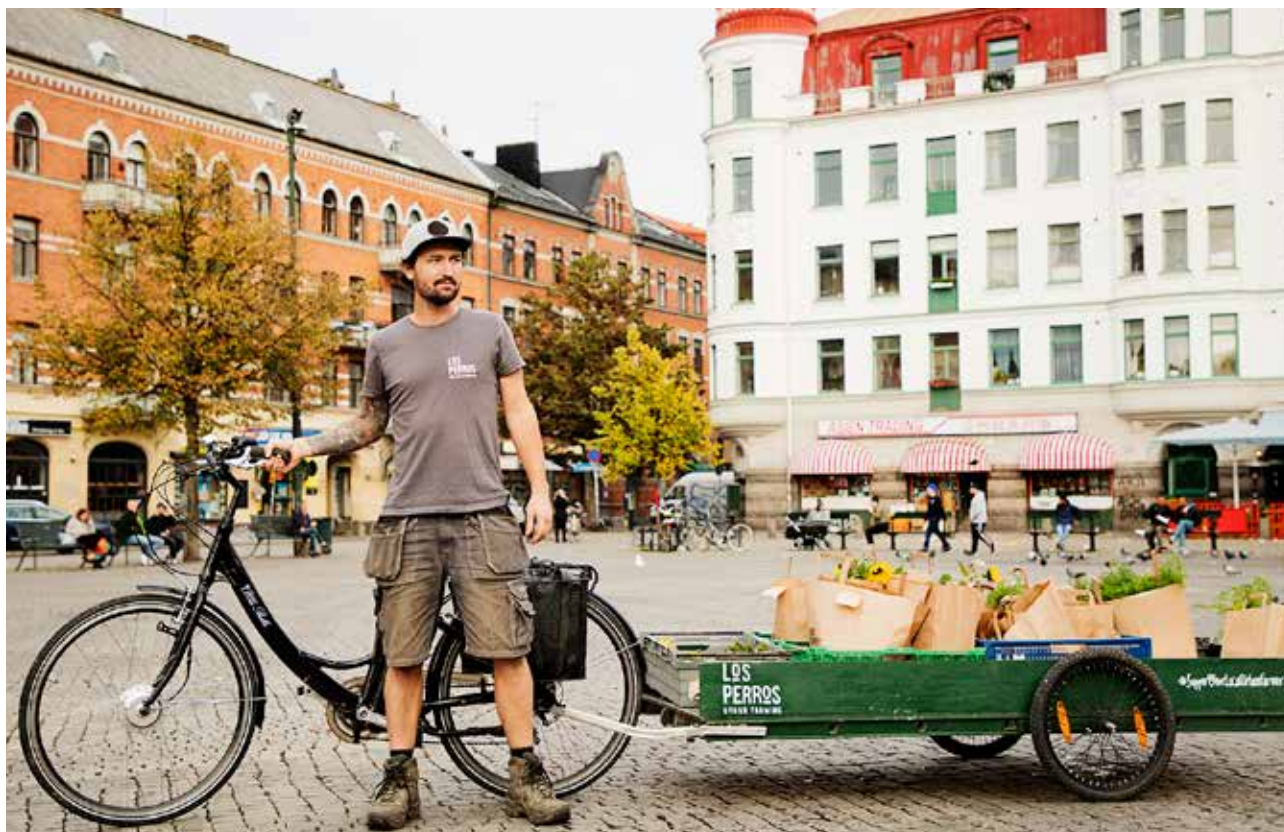
Blomsterodling med Landet Oss på Västra Skrävlinge och utlämning av varor av Los Perros Urban Farming genom nätverket REKO-ringen i Malmö.