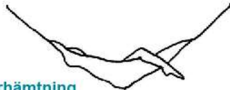
En stunds återhämtning