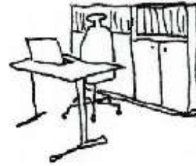
Dialog med kollega