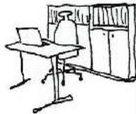
Snabbt utbyte av information